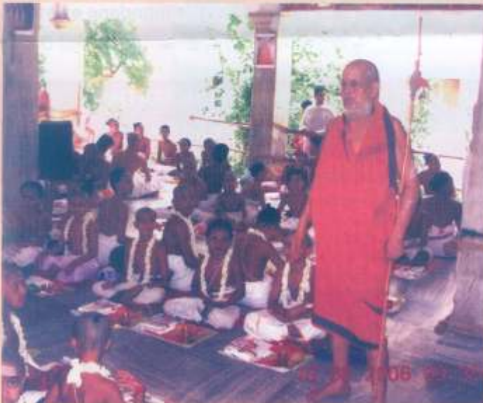
The Acharya at the 72-vatu puja at Kanchi.

The 72nd Jayanti of Pujyashri Jayendra Saraswati Swamigal was celebrated with great devotional fervour at the Kanchi Math on 10.8.2006. After worshipping at the Adhishtanam of Pujyashri Mahaswamigal, Pujyashri Acharya proceeded to the temple of Sri Kamakshi in a procession with caparisoned elephants leading and women carrying 108 milk pots following to the accompaniment of nadaswara music and 72 tavil players. After performing abhishekam to Goddess Kamakshi with milk from 108 pots, the Acharya decorated the idols of Kamakshi and Adi Sankara with golden kireetams. He was offered temple honours. The Acharya gave anugrahahashanam to the multitude of devotees who had gathered at the temple.