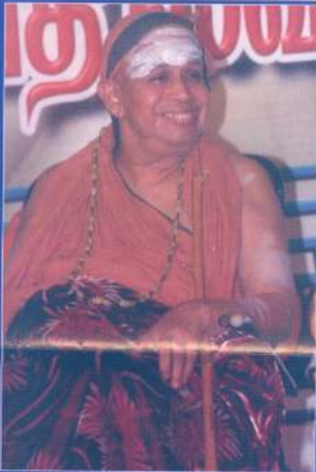
Pujyashri Jayendra Saraswati Swamigal at his 72nd Jayanti Celebrations at Vani Mahal, Chennai.

A QUARTERLY NEWSLETTER HIGHLIGHTING THE ACTIVITIES OF THE KANCHI MATH