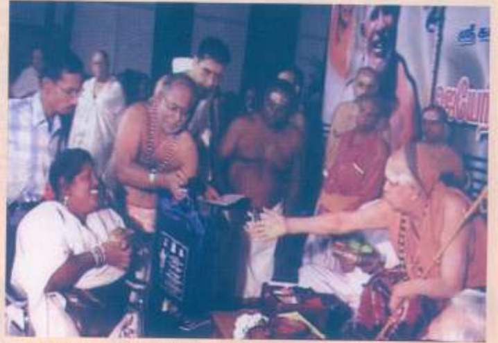
The Acharya presenting a tri-cycle to a handicapped woman.

30 devotees of the Kanchi Math were honoured by Pujyashri Acharya with "Guru Seva" awards. In connection with the Jayanti, some 500 College students had donated blood and the various institutions to which they belonged were honoured by the Acharya with shields. 72 poor and upright people chosen on the basis of local enquiries representing a cross-section of society in and around Chennai city were given awards. Jana Kalyan, Chennai District availed this opportunity to give scholarships