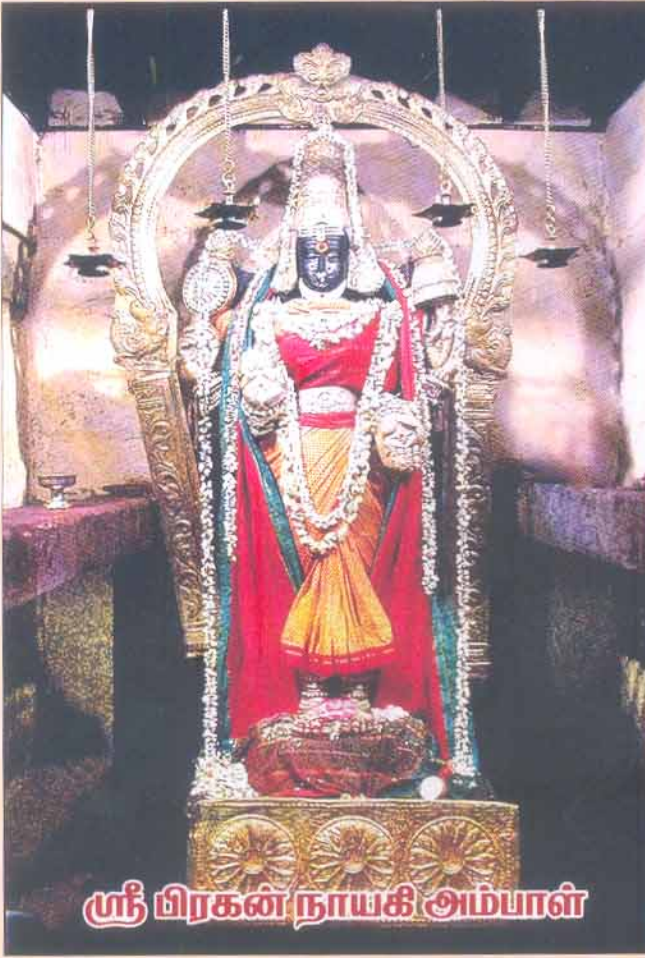
ஸ்ரீ பிரகன்நாயகி அம்பாள்