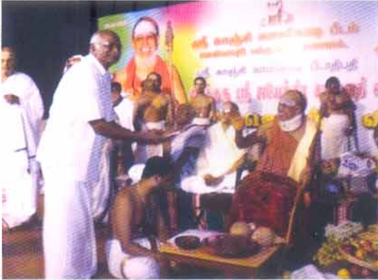
73rd Jayanti Celebrations of Pujyashri Kanchi Acharya at Vani Mahal, T.Nagar, Chennai.

A QUARTERLY NEWSLETTER HIGHLIGHTING THE ACTIVITIES OF THE KANCHI MATH