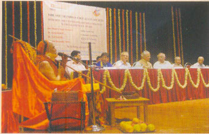
H.H. Pujyashri Jayendra Saraswati Swamigal addresses