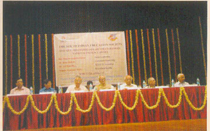
The 10th SIES Sri Chandrasekarendra Saraswati National Eminence Awardees